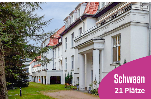
Schwaan 21 Plätze

SCHWAAN. Seit dem 1. Oktober 2022 haben wir auch einen Standort in Mecklenburg-Vorpommern. Direkt am Waldesrand haben wir hier das Haus der Intensivpflege Schwaan übernommen. Dieser Standort ist nicht nur erhaltensam von der Lage, er ist auch ideal in den Campus der Fachkliniken Waldeck integriert. Dort verfügt man seit Jahren über eine große Erfahrung in Beatmung und Beatmungsentwöhnung, was diesen Standort sehr leistungsfähig im Bereich der außerklinischen Intensivpflege macht.