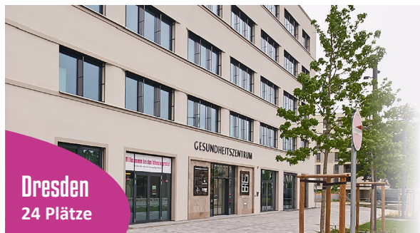
Dresden 24 Plätze

DRESDEN. Mit Wirkung vom 01.06.2024 hat unsere Einrichtung in Dresden den Betrieb aufgenommen. Im Gesundheitszentrum Dresden Mitte erstreckt sich die Comcura über drei Etagen. Nicht nur die schönen Räumlichkeiten, sondern auch die pflegerische, therapeutische und ärztliche Versorgung bieten ein hohes Maß an Qualität und sorgen dafür, dass sich unsere Patient:innen von Anfang an bei uns wohlfühlen. Die optimale Verkehrsanbindung ermöglicht es unseren Besuchern direkt vor der Tür auszusteigen und ihren Besuchen nachzukommen. Unsere Mitarbeitende finden eine moderne, nach dem neuesten Stand der Wissenschaft ausgerichtete Einrichtung. Neue Patient:innen finden bei uns vollausgestattete Einzelzimmer mit inkludiertem Badezimmer.