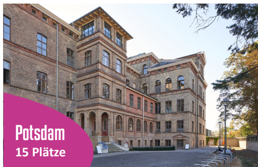
Potsdam 15 Plätze