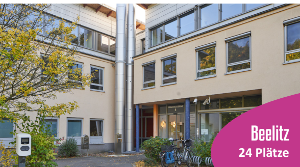
Beelitz 24 Plätze

POTSDAM. Neu eröffnet am 18. August 2022 liegt diese Einrichtung in einem frisch renovierten, denkmalgeschützten Gebäude – wunderschön direkt am Park Sanssouci. Die Einrichtung verfügt ausschließlich über Einzelzimmern mit eigenem, barrierefreiem Bad-Sanitärbereich sowie Aufenthaltsräumen und einem Pflegebad. Die außergewöhnliche Lage am Park Sanssouci hilft nach stressigen Momenten in der Intensivpflege auch einmal zwischendurch zu entspannen – beispielsweise auf der von uns gesponserten Parkbank im anliegenden Mary Park.